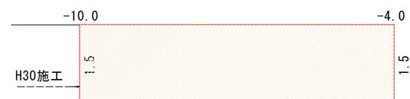
展 開 図 S = 1 : 1 0